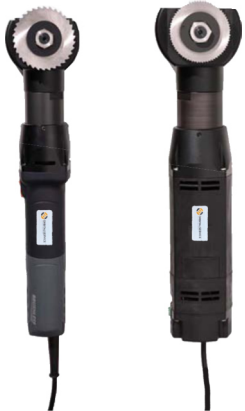
OTSM-1220 1300W standaard