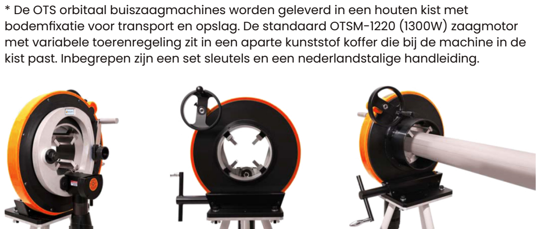
OTSM-2220 1500W optioneel

* De OTS orbitaal buiszaagmachines worden geleverd in een houten kist met bodemfixatie voor transport en opslag. De standaard OTSM-1220 (1300W) zaagmotor met variabele toerenregeling zit in een aparte kunststof koffer die bij de machine in de kist past. Inbegrepen zijn een set sleutels en een nederlandstalige handleiding.